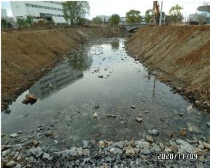
퇴적물 및 쇄석깔기 정비 현황