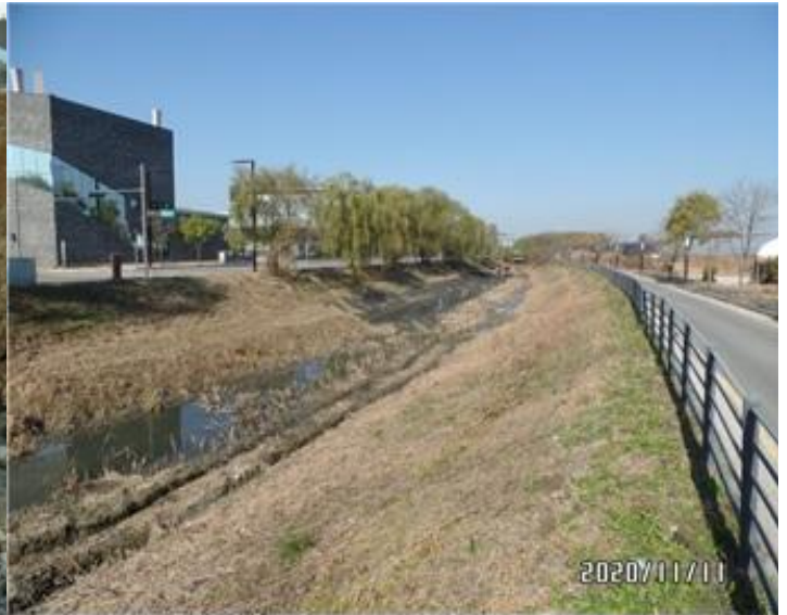
잡풀, 잡목 및 퇴적물 정비 현황

최근 동절기를 맞이하여 2단계 활자마을의 우수지 악취문제가 다시 발생되어 관계기관인 경기도와 파주시에서는 지속적으로 사업장 및 수질 점검을 통해 관리 중에 있습니다.