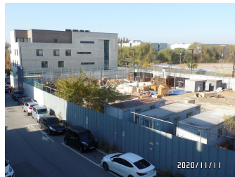
자음과모음 (골조공사 중)