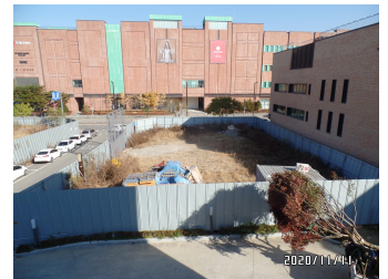
파랑새 (공사준비 중)