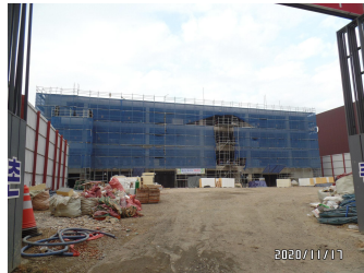
다산복스 (마감공사 중)