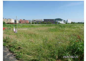
천재교과서 외 2필지 (공사준비 중)