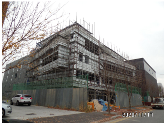
굿미디어 (마감공사 중)