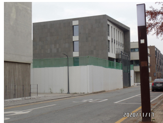
KRCG (공사준비 중)