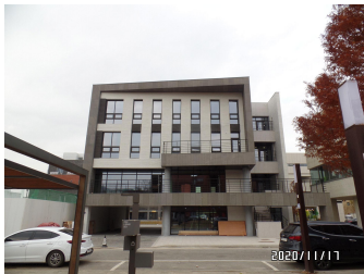
문학수첩 (마감공사 중)